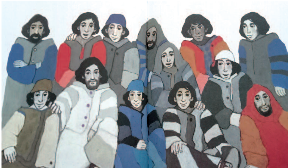
De twaalf discipelen. Uit: Kijkbijbel