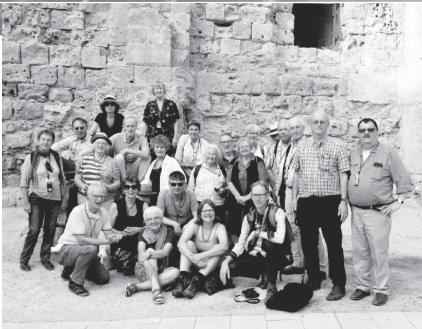
Groepsfoto in Israël

stramien van de 'zwartekousenkerk'. Zetten zich af tegen de manier waarop wij geloven en hoe wij dit willen uitdragen. Nogmaals ik heb respect voor alle geloven alleen ik doe het op mijn manier."