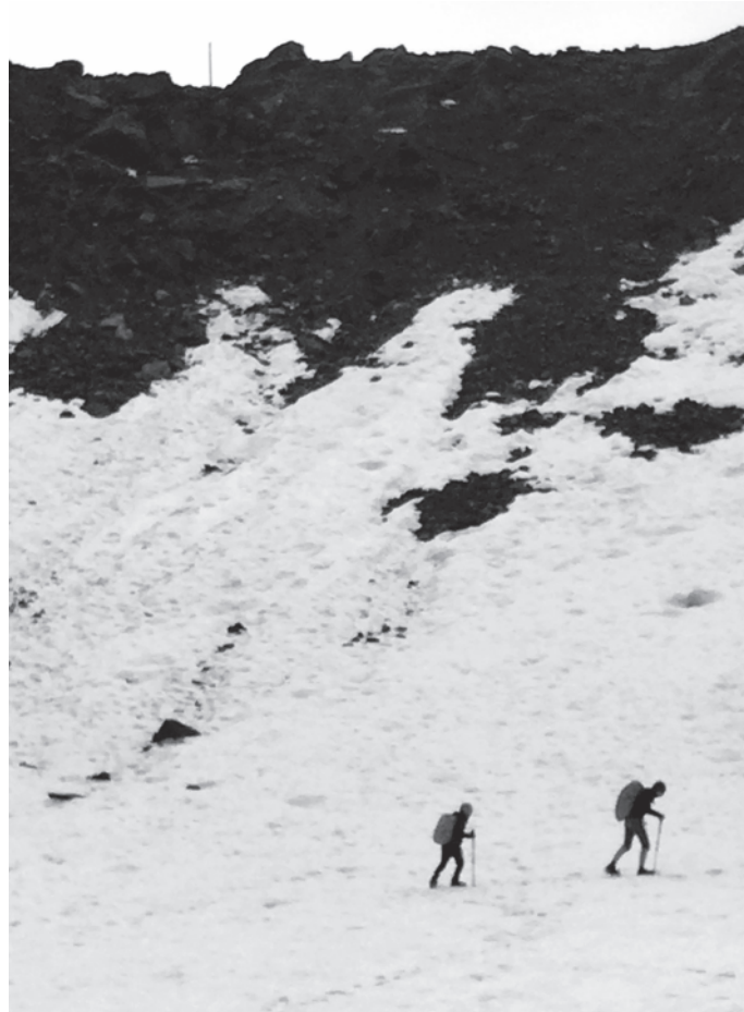
Essemie van Dunné – In het buitenland op 1,5 meter afstand