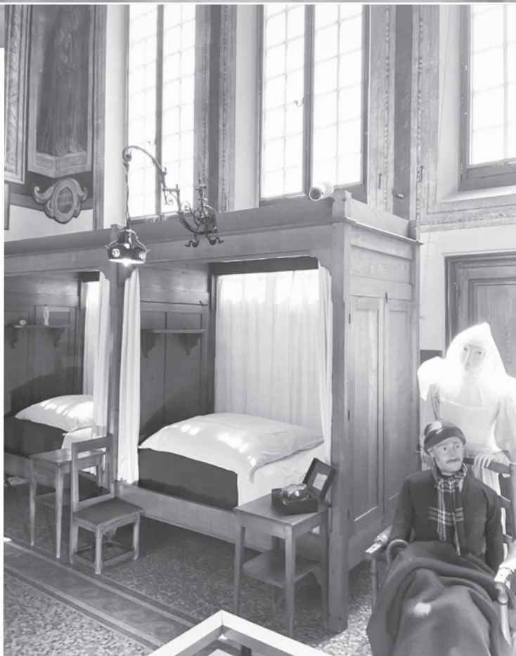
De grote ziekenzaal van het Hôtel Dieu