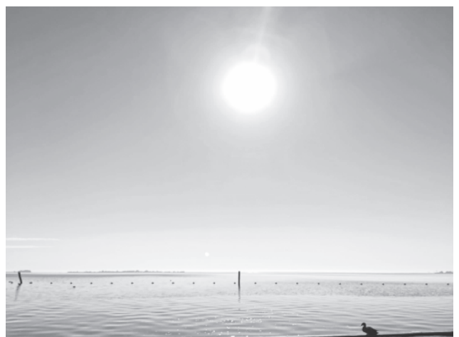
Wim de Vries Lentsch – Tijdens de hittegolf