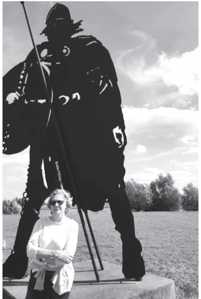
Sjoukje Halbertsma – Standbeeld van een Viking in Dorestad nu Wijk bij Duurstede