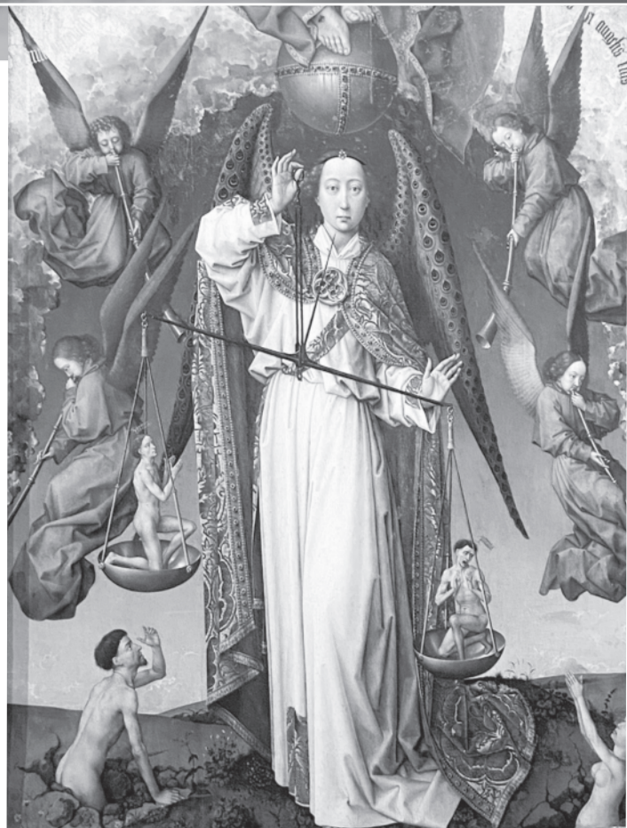
Rogier van der Weyden: 'de aartsengel Michaël weegt de zielen', detail van het altaarretabel 'het Laatste Oordeel', Hôtel Dieu te Beaune

Als je werd binnengebracht in dat hospitaal, werd je bij binnenkomst door één van die vliegende nonnen opgewacht, en meteen naar het biechthokje gebracht. En ik dacht meteen bij mezelf: "Zo zie je maar weer. Goed dat wij protestanten de biecht hebben afgeschafft. Zal je me daar als doodziek mens bij de poort komen, mag je eerst je zonden biechten". Daarna word je in bed gelegd, maar je wordt onmiddellijk opnieuw gemanipuleerd, want of je wilt of niet, je kijkt uit op het altaar. En daarachter het retabel, een groot schilderij – een preek in plaatjes – toegeschreven aan Rogier van der Weyden – voorstellende, ja, wat zou je denken? Wat zou deze kunstenaar aan de zieke in het Hôtel Dieu, dit gasthuis Gods, voor ogen willen houden? Nou, hou je vast: een afbeelding van het Laatste Oordeel. Het einde der tijden is aangebroken, bazuinen schallen, de aarde scheurt en de graven gaan open.