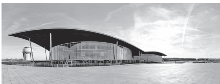
Het stadion L'Axone in Montbéliard

We duiken allemaal op eigen wijs onder in een enorm programma van lezingen, optredens en muziek, waaronder popbands, relizangeressen, koren en een heus christelijk symfonie orkest, alles in de grote arena met stootvrije stoelen. Nederlanders hebben daarin een bescheiden, maar uitgesproken bijdrage.