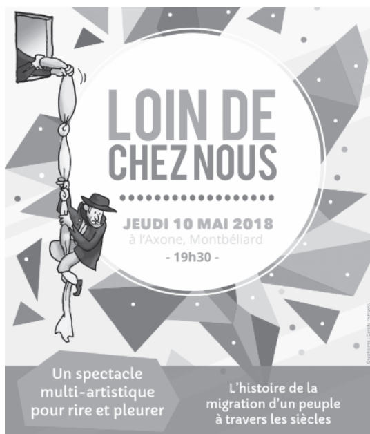
Affiche voor een bijeenkomst tijdens MERK